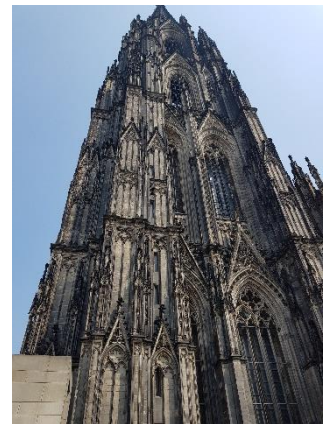
A kölni dóm

Vasárnap Padebornba indultunk, a világ legnagyobb számítástechnikai múzeumát, a Heinz Nixdorf Museumsforum-ot meglátogatni. Tárlatvezetéssel jártuk be a háromszintes épületet, ahol a névadó Heinz Nixdorf mellett Neumann János munkássága is fontos szerepet játszott. Ezután a belvárosba indultunk, a történelmi épületeket felfedezni. Este a Cosack farmon ünnepeltük meg a cserekapcsolat 25. évfordulóját, finom vacsora és kisfilm mellett.