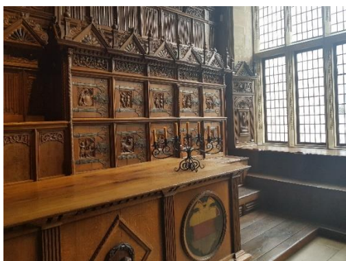
Münster, Városház, Béketerem

Szerdán a Fort Fun kalandparkban hódolhattunk az adrenalin utáni vágynak. Voltak hullámvasutak, bob, körhinta, óriáskerék és drótkötélpálya. A hazautat fáradtan, de jó hangulatban, énekelve töltöttük.