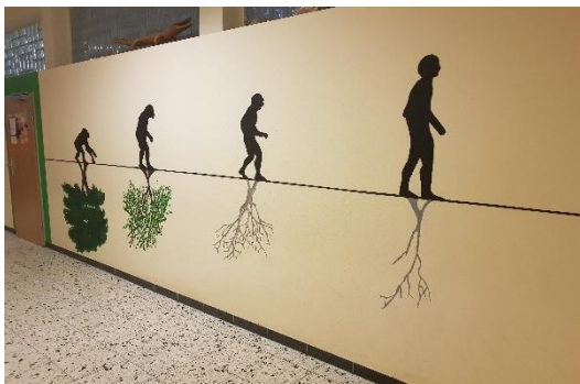
Lippstadt, Marienschule, Biológia terem

Másnap órákat látogattunk az iskolában. Volt szerencsém egy dupla franciaórát megtekinteni, úgy, hogy a „je mapelle” és a „merci” kimeríti az eddigi szókincsem. A tanárnő nagyon lelkes volt, megkért minket, hogy tanítsuk egy kicsit magyarul a csoportot és őt is, így egy órán keresztül átvehettük a katedrát. Délután Rietbergbe indultunk, egy hatalmas, felnőtt méretű játszótérre. Mindenki jól érezte magát, az óriáscsúzdák és a vizes játékok még a tanárainkból is előhozták a bennük megbúvó kisgyermeket.