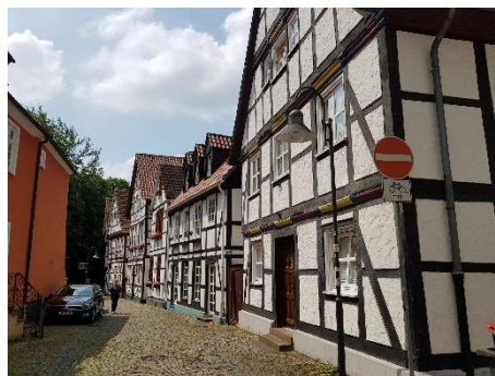
Lippstadt belvárosának utcái

Kedden Lippstadt városát indultunk felfedezni. Felépítésében Egerhez nagyon hasonló, a központjában nagy park terül el. Láttuk a Kedves Nővérek apácarend régi kolostorát, egy idősek otthonát, ahol a rangon aluli házasság helyett, inkább az örök magányt választó, német nemesi családok leányai élnek és az egykori zsina-góga emlékét. A polgármesteri hivatalban az alpolgármester fogadott minket, majd szabad programra indultunk. A csoport egyik fele bowlingozott, a másik része focigolfozott.