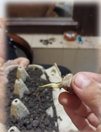
Horváth Nelli 11t