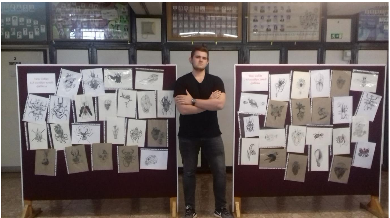
A nyertes mű